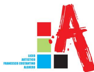
Liceo Artistico "F. Costantino"