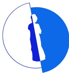
Liceo Classico "G. Manno"