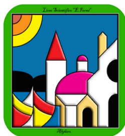
Liceo Scientifico "E. Fermi"